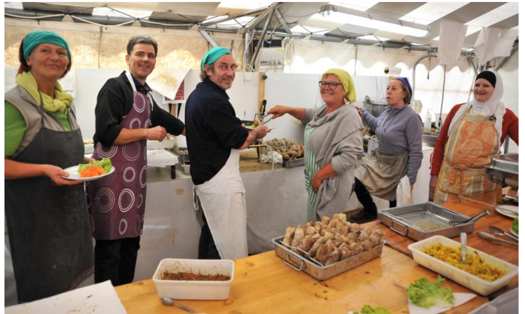
Mobilisation générale des bénévoles... pour la bonne cause.