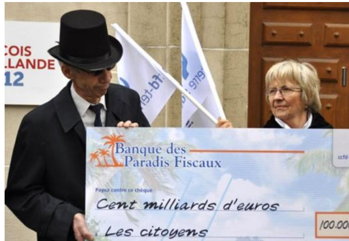
La Foire éco-bio donne l'occasion de s'informer et agir contre les paradis fiscaux pour récupérer des milliards.

DEPUIS DE LONGS MOIS, des Alsaciens, membres du CCFD - Terre solidaire se sont engagés dans des campagnes de lutte contre les paradis fiscaux, mobilisant des citoyens à écrire à leur banque, interpellant les collectivités locales (plusieurs en Alsace ont répondu positivement) et relayant les campagnes nationales et internationales. Ils invitent le public à (re)voir le film de Xavier Harel déjà diffusé sur Arte et à par-